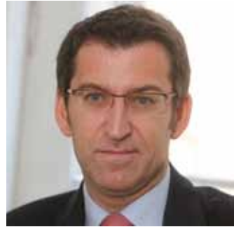
D. Alberto Núñez Feijóo

E así seguirá sendo no futuro para facer cada vez máis pequenas as diferenzas entre a Galicia rural e a Galicia urbana. A Galicia rural forma parte de todos nós porque todos temos un presente ou un pasado labrego. E nesas raíces están as nosas forzas, o pulo que nos leva a erguermos das dificultades e nos di que hai un futuro se traballamos xuntos.