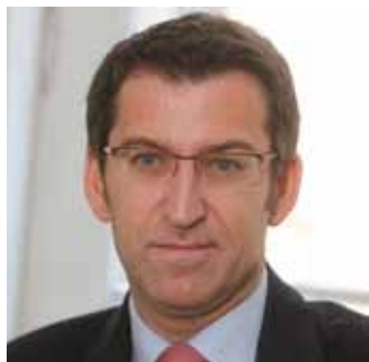
D. Alberto Núñez Feijóo

Frente a los que ven en las aldeas un modo de vida antiguo, yo creo que en ellas radica un fondo de creatividad y una consistencia estrechamente relacionada con el desarrollo cultural, social y económico de Galicia. Es mucho lo que el campo aportó a la modernización de Galicia y es mucho lo que el campo tiene aún que aportarnos.