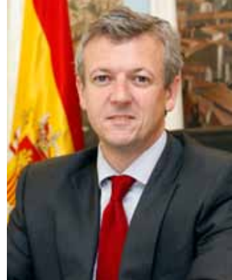
D. Alfonso Rueda Valenzuela

Desde el Gobierno gallego estamos comprometidos con el reequilibrio territorial y con una Galicia que ofrezca las mismas oportunidades a sus ciudadanos sea cual fuere el lugar donde viven. El sector primario tiene marcado el pasado de Galicia y estamos convencidos de que también tiene futuro. Cimag es el vivo ejemplo de que la innovación casa con el mantenimiento de los sectores tradicionales y que, aún más, es un impulso para su desarrollo. Solo me queda desear el mayor de los éxitos al certamen, ya que será garantía a su vez del éxito del agro gallego.