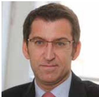
Mr. Alberto Núñez Feijóo

There are those who see in our Galician villages an old fashioned way of life, but I think that there lies a background of creativity and consistency, elements that are closely related to the cultural, economic and social boom of Galicia. The countryland has greatly contributed to the modernisation of Galicia, and still has much more to provide to us all.