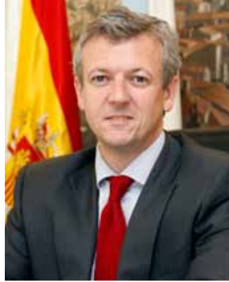
Mr. Alfonso Rueda Valenzuela

The Galician Government is committed to obtain territorial equilibrium and a Galicia that will offers equal opportunity to its citizens regardless of where they are living. The primary sector has marked the history of Galicia and we are convinced that it has a future as well. Cimac is a living example, that innovation blends with the maintenance of traditional sectors, and further, it is a boost towards their development. I only wish the greatest success to the fair since it will turn into a guarantee for the Galician agricultural sector.