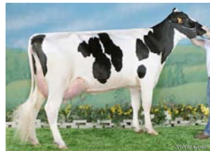
BOS BOLTON MALORIE ET MB85-1ºp. x DEMPSEY