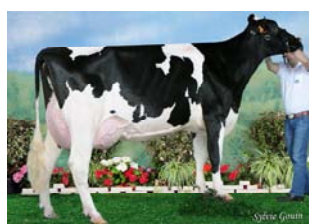
BOS TOYSTORY WANDA ET MB87 x LAUTHORITY